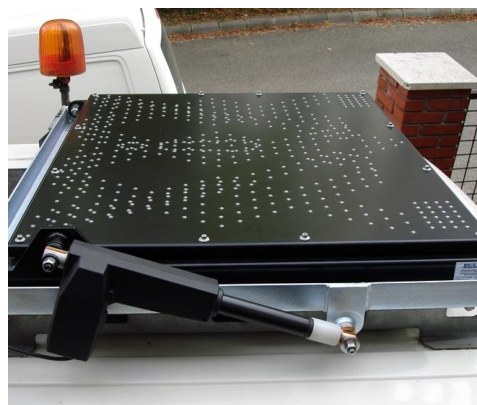
FORT-KÍSÉRŐ MOTOROS EMELŐVEL